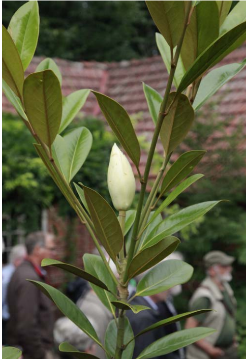
Fig. 8. Magnolia grandiflora 'Exmouth' på friland på Ulriksdals planteskole.