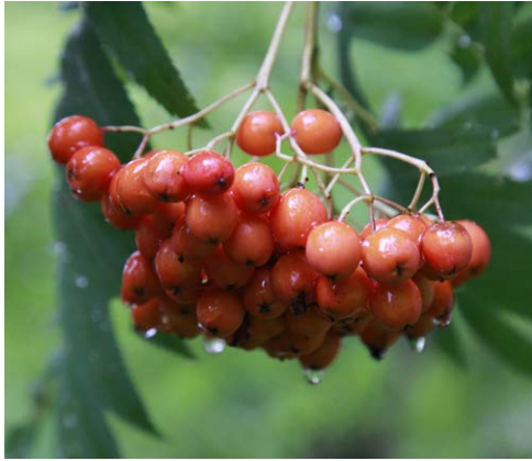
Fig. 2. Sorbus ulleungensis 'Dodong'.