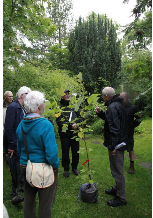
Fig. 3. Værtsgaven, en Liriodendron chinense (kinesisk tulipantræ), viste sig at være meget kærkommen, da havens højt skattede (amerikanske) tulipantræ for nogle år siden blev ødelagt i stormen 'Gudrun'.