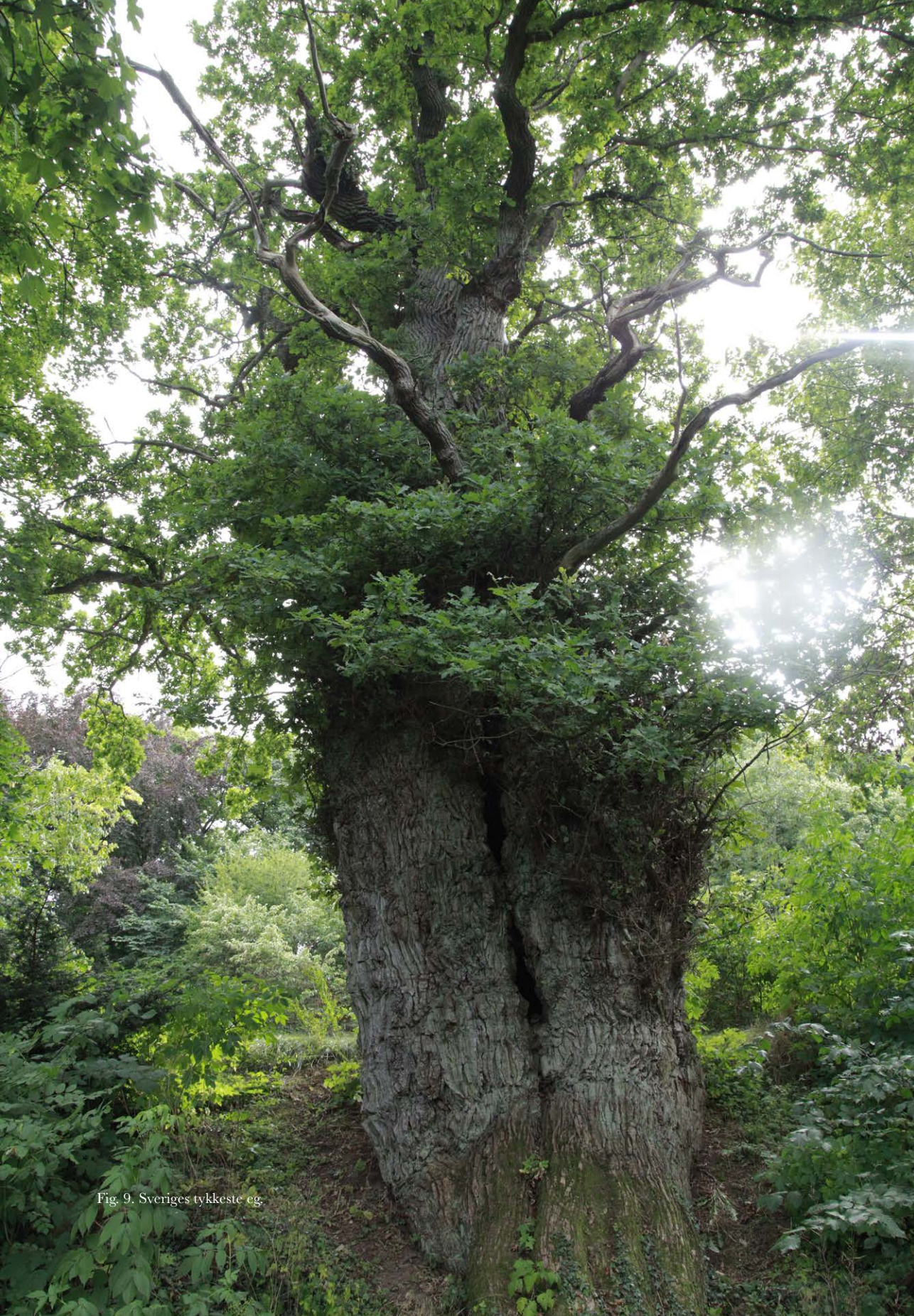
Fig. 9. Sveriges tykkeste eg.