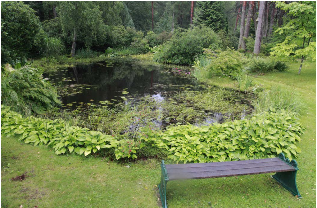
Fig. 1. Der var vådt overalt på Vargaslätten: En lille sø med røde nøkkeroser.

Efter den noget regntunge omvisning i parken fik vi serveret kaffe i det gamle og