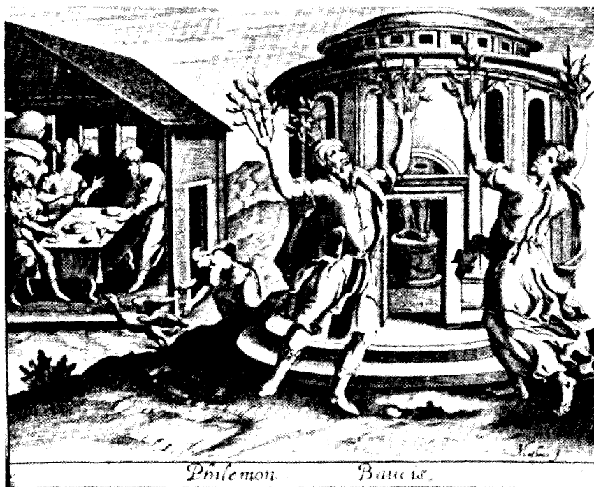
Fig. 5. Sådan forestillede den franske kunstner Jean Matheus sig i 1619 at det gik til, da Philemon og Baukis blev forvandlet til træer.

København er smuk, til trods for at alle kan se, at den er døden nær? Der er nok to forklaringer. Den ene er, at sådanne træer, der har levet længere, end de normalt skulle, giver håbet om en udskudt død: Kan træer blive unormalt gamle, så kan mennesker vel også, og hvorfor skulle det ikke være netop mig.