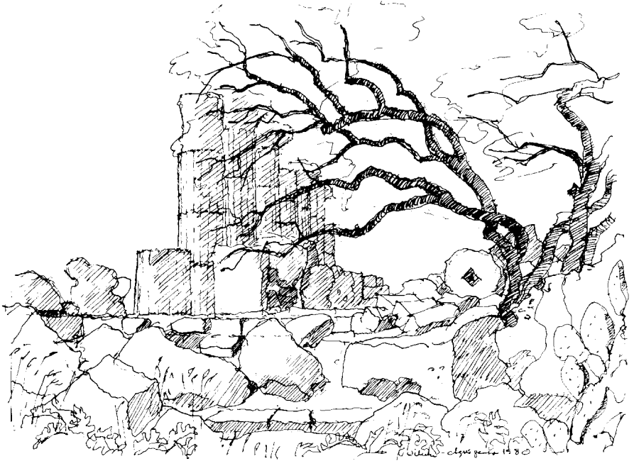
Fig. 4. Ruiner taler til vores følelser, og gamle krogede træer synes vi er smukke, fordi vi kan identificere os med dem. Så bliver sammenstillingen af tempelruiner og gamle oliventræer til et stærkt billede og et yndet motiv for tegneren. Tegning af Vibeke Fischer Thomsen.

rådhuset i Gentofte og de ballader fra middelalderen, hvor den ædle jomfru på en eller anden måde forbindes med lindetræer.