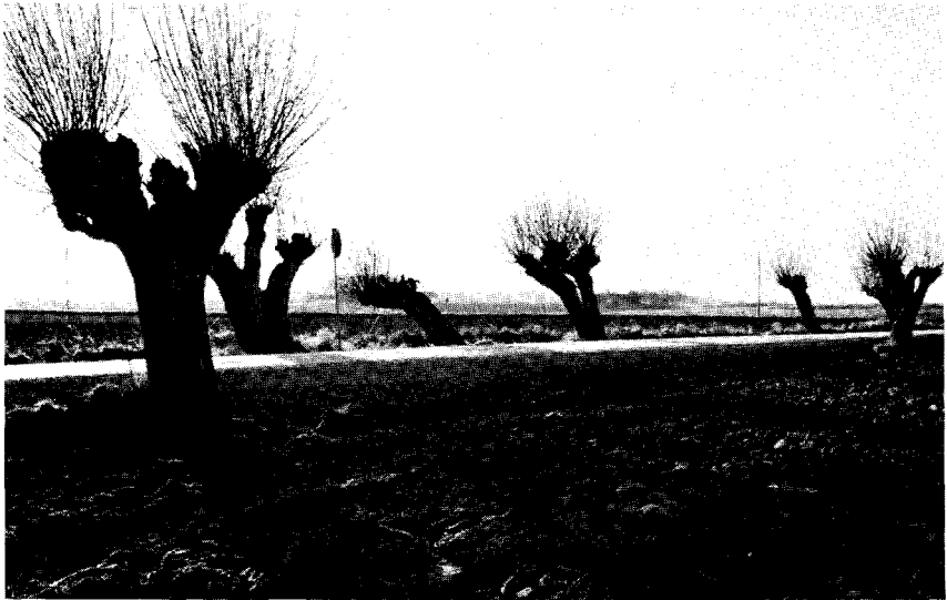
Fig. 2. Stynede træer har deres kulturtekniske historie og forklaring. Når de opfattes som smukke og bliver fotografiske motiver, kan grunden vel også være kulturhistorisk, men mon ikke den æstetiske virkning beror på deres stærke karakter, deres identitet.