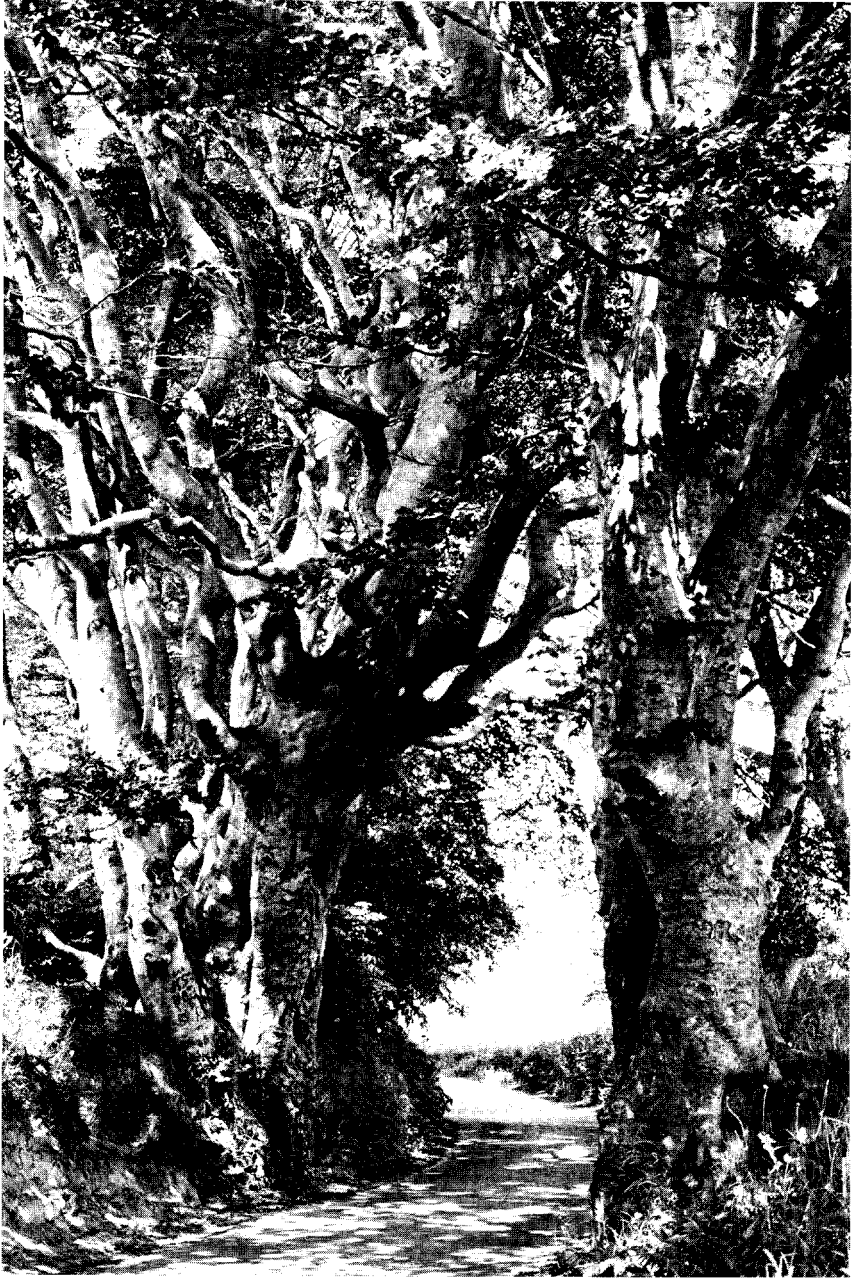
Fig. 1. Var der tale om produktion og økonomi, så kunne der ikke siges meget smukt om disse bøgetræer. Men de har en form, som kan beskrives med ord som ornamental skønhed, og derved bliver de et yndet motiv for fotografer og kunstnere.