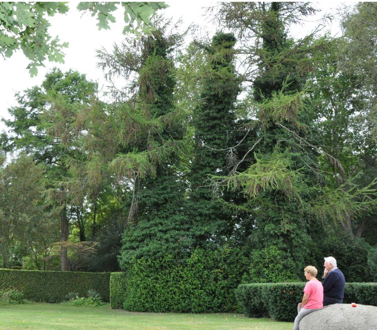
Den store, flade sten ved indgangen til arboretet.

Quercus petraea , vintereg, har han anvendt. Birk er et andet favorittræ, og her er det især de karakteristiske barktyper, der gør træerne attraktive: Betula utilis , himalaya-birk, med afskallende, hvid bark, Betula albosinensis var. septentrionalis , kobberbirk, med stærkt kobberød-brunrød afskallende bark samt Betula ermaniï , kamtchatka-birk, også med afskallende bark, som er cremehvid eller rosa-hvid evt. lidt gullig.