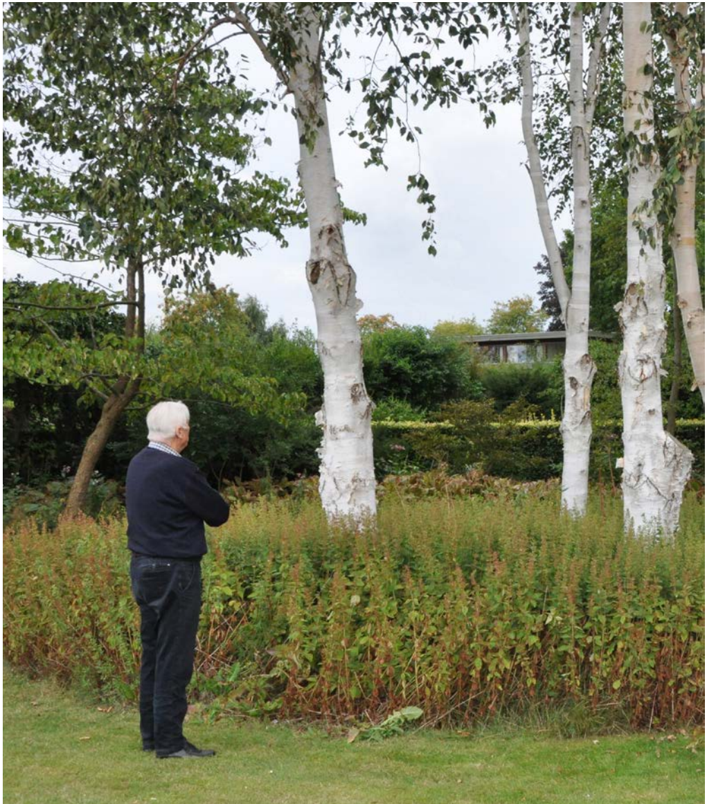
En lille gruppe af Betula utilis , himalayabirk med "fodpose" af Lysimachia punctata , prikbladet fredløs.

punctata , prikbladet fredløs, som 'fodpose'. Det er enkelt, og her skal ikke luges, prikbladet fredløs holder ukrudtet væk, og er dermed et velegnet islæt i den 'rynkede have', et begreb, som Jørgen Holm introducerer. Det henviser til den have, som ejes og passes af ældre haveejere, der helst ikke vil luge og ordne kanter omkring bede.