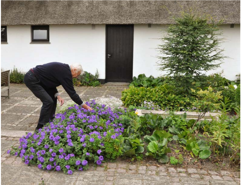
Billede af terrassen, der lever op til Jørgen Holms haveprincip om farver, kontraster og enkelhed. I baggrunden mod den hvide mur Nothofagus sp., sydbøg.

Her kan man blot køre med plæneklippen helt ind til planterne, indtil bedet har en passende størrelse!